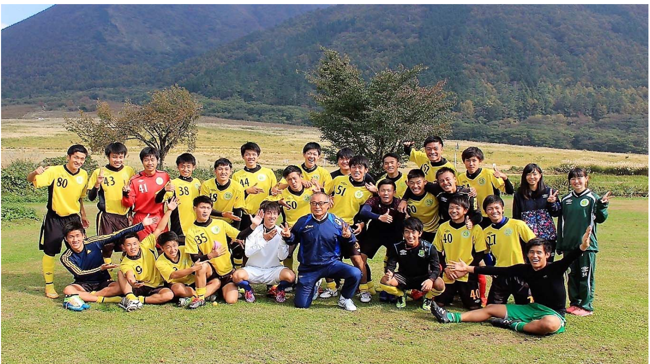
選手権前の三瓶練習後に3年全員、1-2年メンバーと撮った写真です。