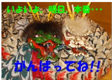
いよいよ、明日、本番…