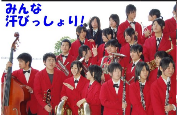
みんな汗びっしょり!