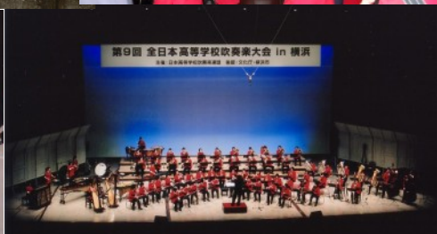
第9回 全日本高等学校吹奏楽大会 in 横浜