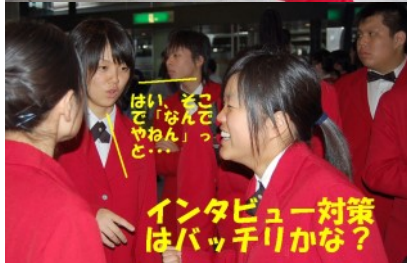
はい、そこで「なんぞやねん」って…