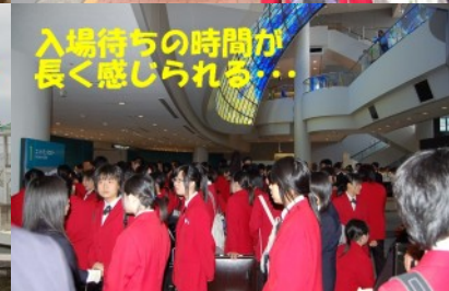
入場待ちの時間が長く感じられる…