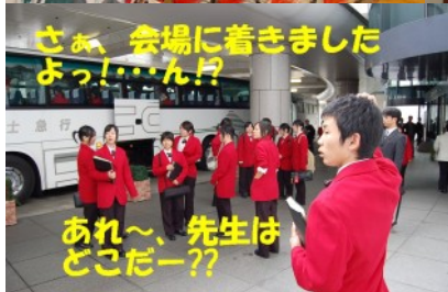
さあ、会場に着きましたよっ!…ん?