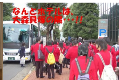
なんとホテルは、大森貝塚の隣…!!