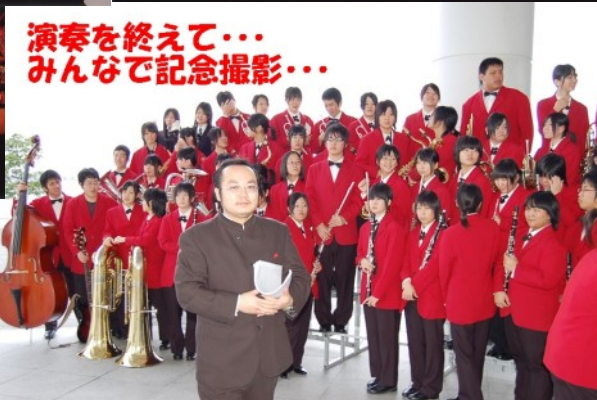
演奏を終えて… みんなで記念撮影…